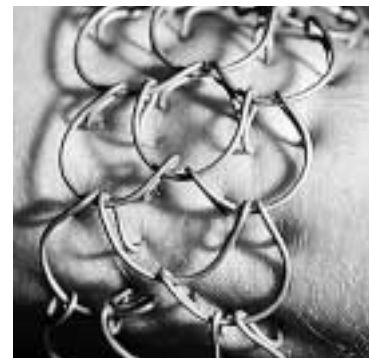
MYSTISK: En Cilicie er en slags piggetrådlenke som bindes hardt rundt låret med piggene vendt innover, og bæres av Opus Dei-medlemmer. I dag svarer Opus Deis informasjonssjef etter Dagbladets artikkel om organisasjonen.